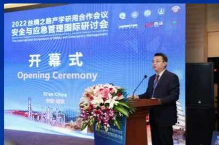
第一届丝绸之路国际产学研用合作会议—安全与应急管理国际研讨会(2022)