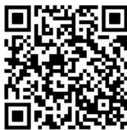
论文摘要模板二维码