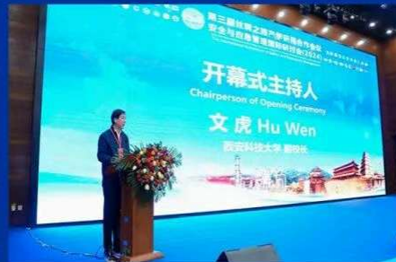
第三届丝绸之路国际产学研用合作会议—安全与应急管理国际研讨会(2024)