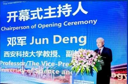
第二届丝绸之路国际产学研用合作会议—安全与应急管理国际研讨会(2023)