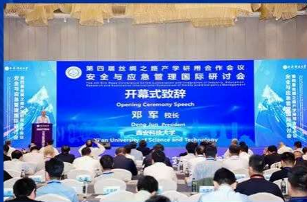
第四届丝绸之路国际产学研用合作会议—安全与应急管理国际研讨会(2025)

为进一步推动安全与应急管理领域教育教学、科学研究、成果孵化、实践应用的互融互通，加快教育对外开放，推动产学研用一体化发展，构建高质量国际合作伙伴关系，教育部已连续主办多届国际产学研用合作会议。根据陕西省教育厅《关于做好2026丝绸之路国际产学研用合作会议暨教育合作交流筹备工作的通知》，西安科技大学作为会议的多届承办高校，现定于2026年5月29日至6月1日，在陕西西安召开第五届丝绸之路国际产学研用合作会议—安全与应急管理国际研讨会(2026)。诚邀高校、科研院所和企业的专家、学者及代表参会交流。